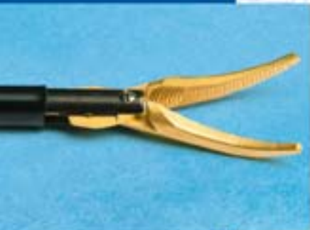
Мод.: MDS5 330 MDS5 470