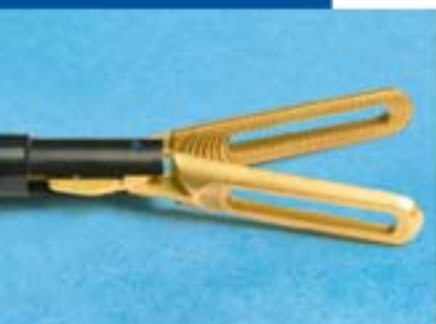
Мод.: F5 330, FS5 330 FSS 470