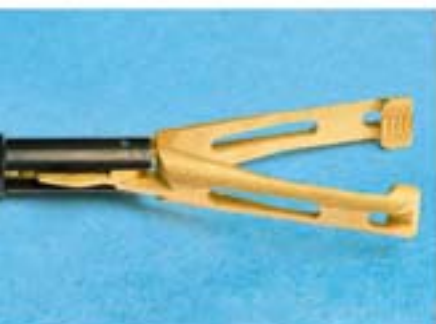
Мод.: ECS5 330, ECS5 470