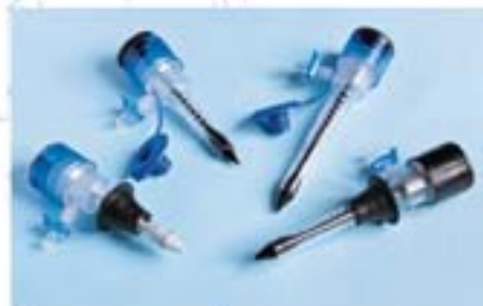
Мод.: 12060, 12060H, 12100, 12100H