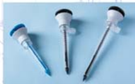
Мод.: 5053, 5068, 5100