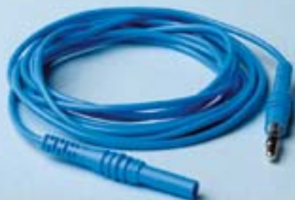
Мод.: CAB 3000