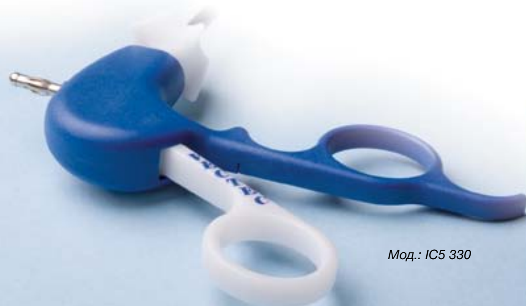
Мод.: IC5 330