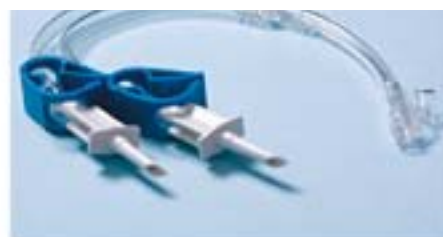
Мод.: CAN DP5