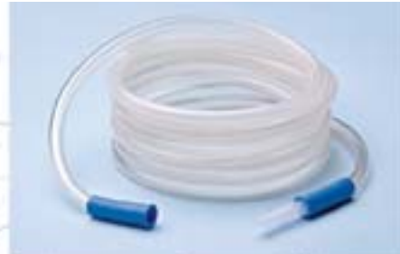
Мод.: RAL 3000

Комплект для аспирации/ирригации герметично упакован и стерилизован этиленоксидом в соответствии со стандартом NF EN ISO 11135-1.